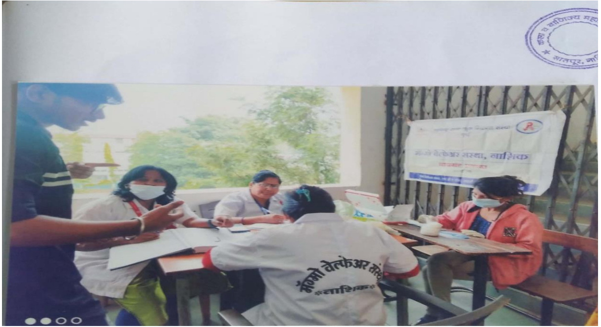
Students Haemoglobin Check-up