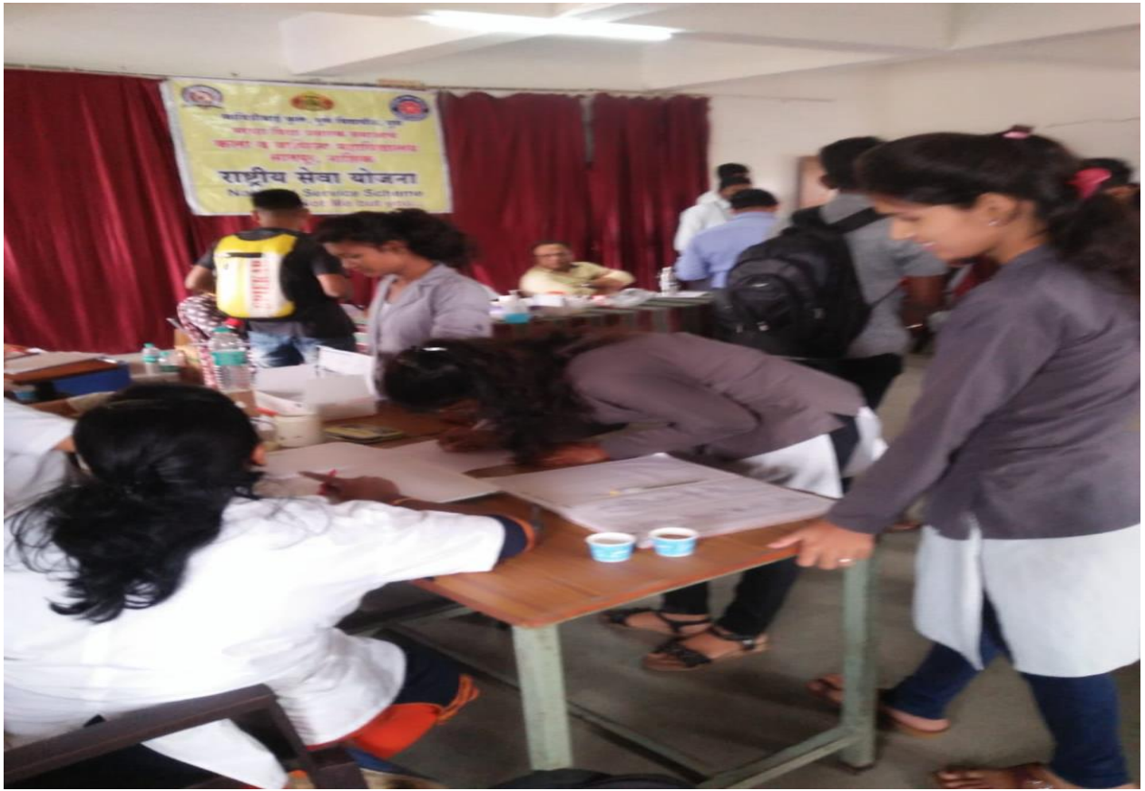
Students Haemoglobin Check-up