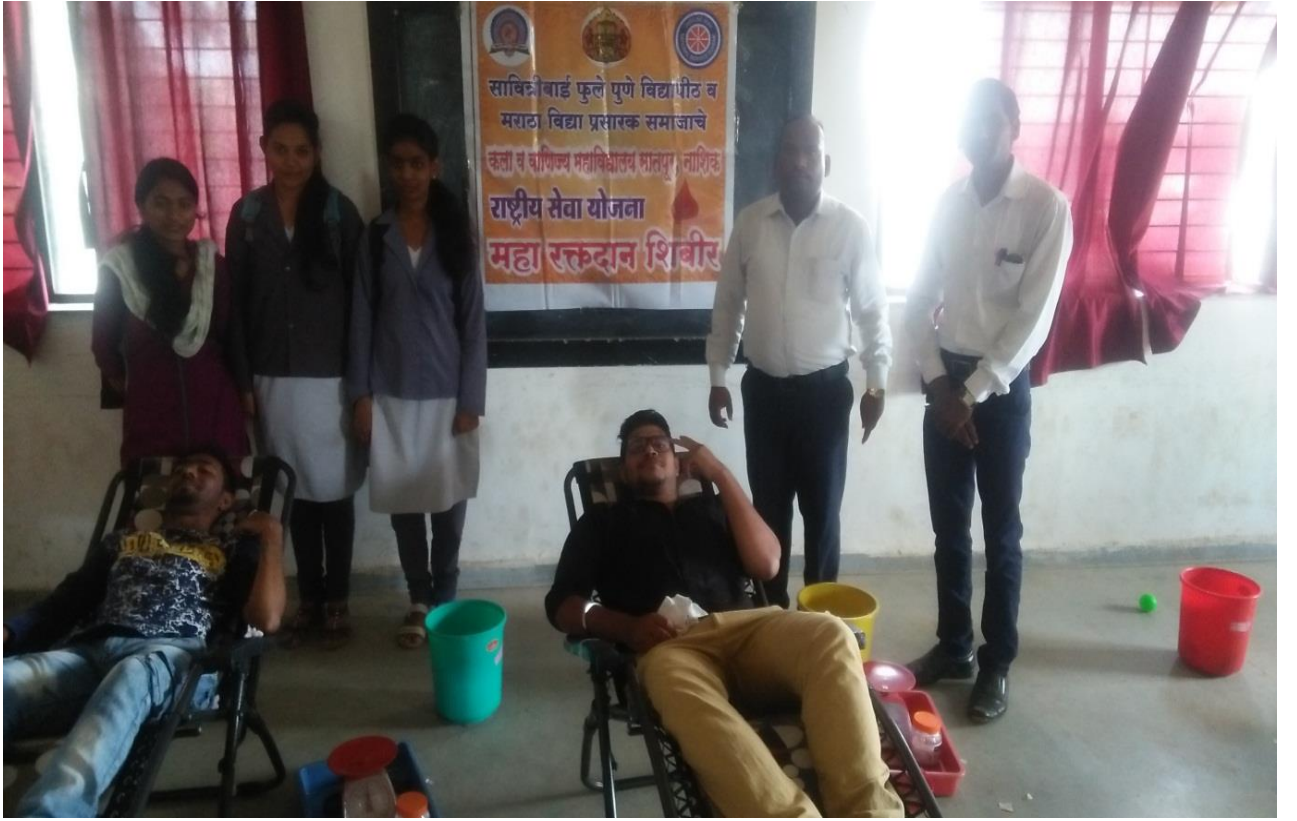
Blood Donation Camp