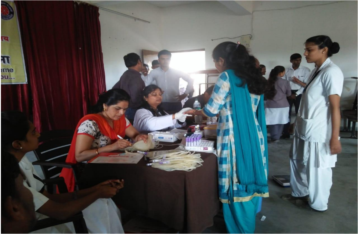
Teachers Haemoglobin Chekup